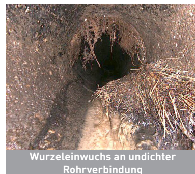
Wurzeinwuchs an undichter Rohrverbindung

Wird der Boden um das Rohr herum ausgewaschen, entstehen Hohlräume. Absackungen an der Oberfläche. Einstürze können die Folge sein.