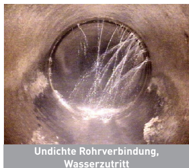
Undichte Rohrverbindung, Wasserzutritt

Tritt sauberes Grundwasser, auch Fremdwasser genannt, in die Abwasserleitung ein, erhöht sich der Abfluss im öffentlichen Kanalnetz. Die Abwasserreinigungs- und Betriebskosten steigen und damit auch die Abwassergebühr. Außerdem kann es zu Rückstau-problemen kommen.