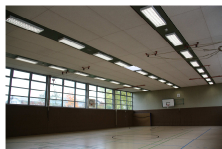
Neue LED Leuchten